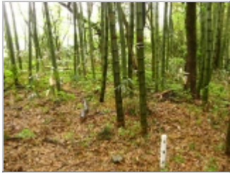
矢立山山頂。三角点あり