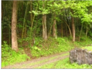
林道脇から登り始める。何となく踏跡あり