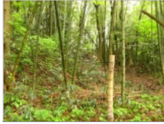
斜面は竹林で藪は無い